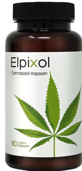
Elpixol Cannabis Kapseln Inhalt: 60 Stk. PZN: 17902764