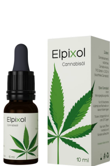
Elpixol Cannabisöl Tropfen 10 ml PZN: 16612550 UVP: 19,99 €