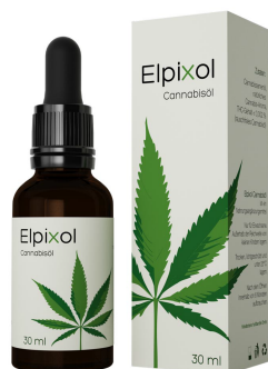
Elpixol Cannabisöl Tropfen 30 ml PZN: 16612544 UVP: 39,99 €