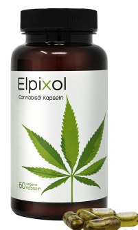
Elpixol Cannabisöl Kapseln 60 St. PZN: 17902764 UVP: 29,95 €