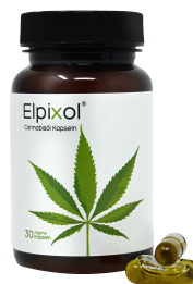
Elpixol Cannabisöl Kapseln 30 St. PZN: 18319133 UVP: 17,95 €