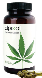
Elpixol Cannabisöl Kapseln 60 St. PZN: 17902764 UVP: 29,95 €