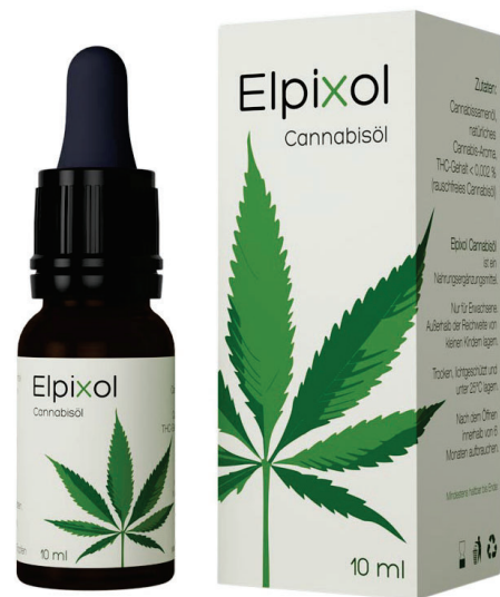
Elpixol Cannabisöl Inhalt: 10 ml. PZN: 16612550