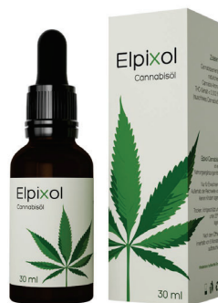
Elpixol Cannabisöl Tropfen 30 ml PZN: 16612544 UVP: 39,99 €