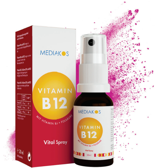
Vitamin B12 + B6 + Folsäure MEDIKOS Vital Spray Inhalt: 20 ml. PZN: 18317654