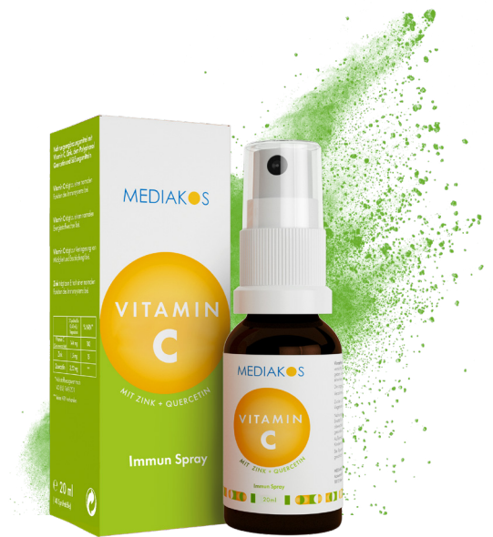
Vitamin C+Zink+Quercetin MEDIKOS Immun Spray Inhalt: 20 ml. PZN: 18369378