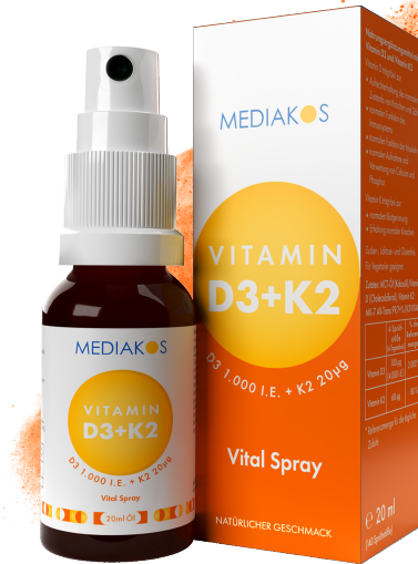
MEDIAKOS Vitamin D3 + K2 1.000 I.E. / 20 µg. Vital Spray Inhalt: 20 ml. PZN: 18133279